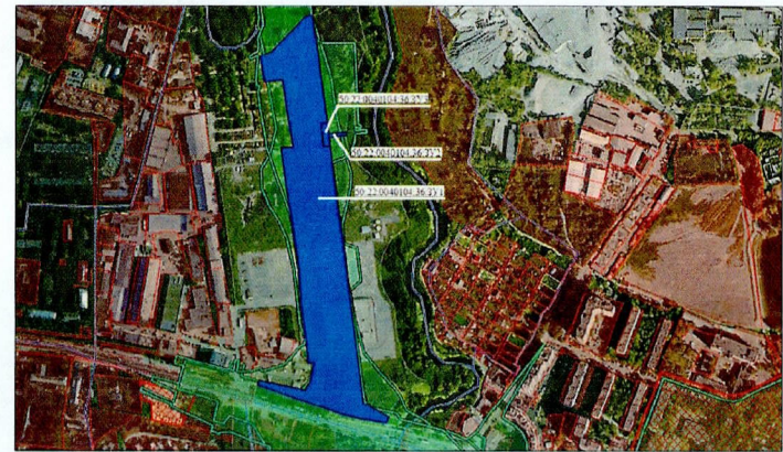
Масштаб 1 : 7500