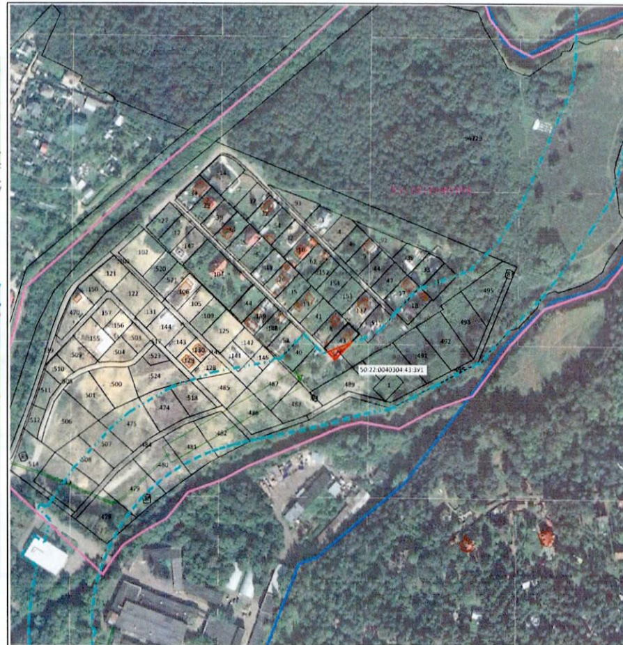
Масштаб 1:4 000