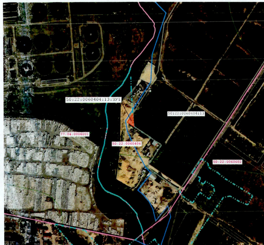
Масштаб 1:5 000